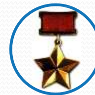
ДЕНЬ ГЕРОЕВ ОТЕЧЕСТВА